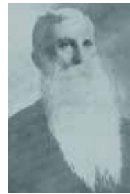
林乐知 (Young John Allen)