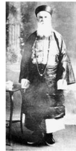
傅兰雅 (John Fryer)