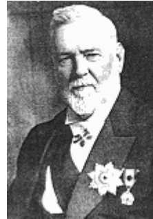
李提摩太 (Timothy Richard)